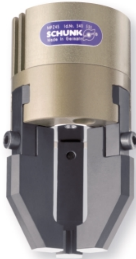
Abbildung: MPZ 45 mit Sonderfingern