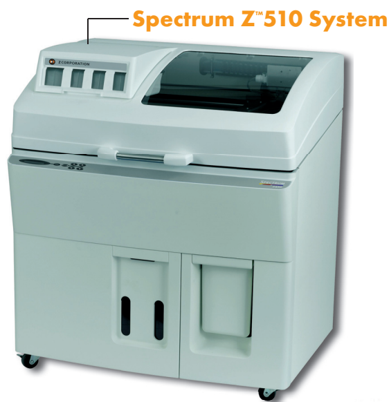
Spectrum Z™ 510 System